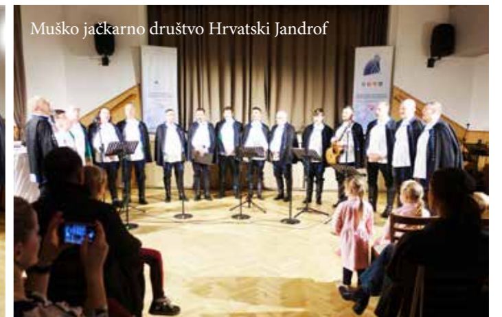
Muško jačkarno društvo Hrvatski Jandrof