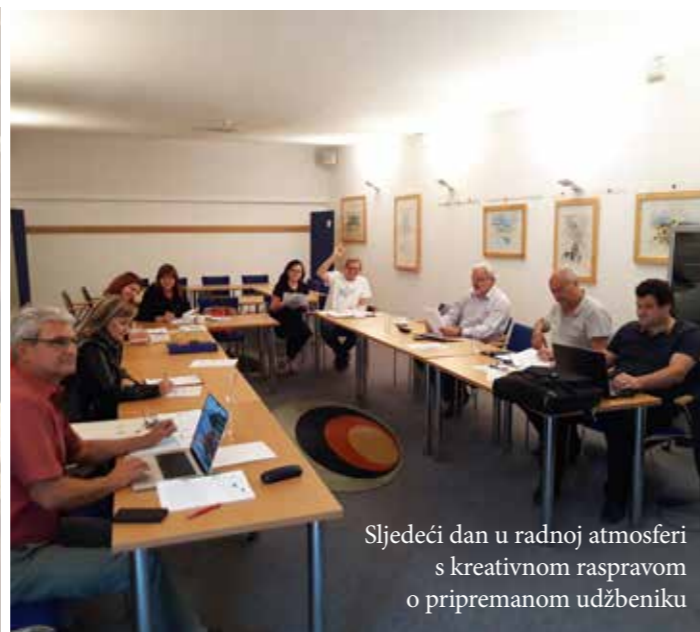
Sljedeći dan u radnoj atmosferi s kreativnom raspravom o pripremanom udžbeniku