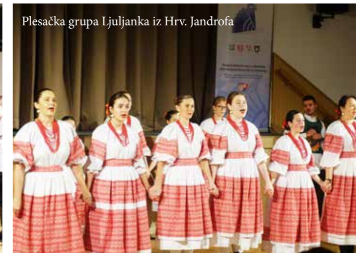
Plesačka grupa Ljuljanka iz Hrv. Jandrofa