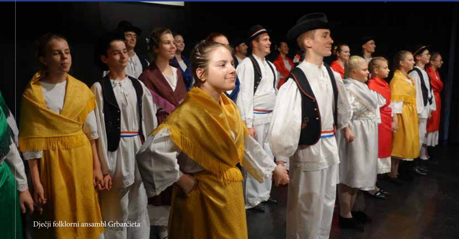
Dječji folklorni ansambl Grbarčieta