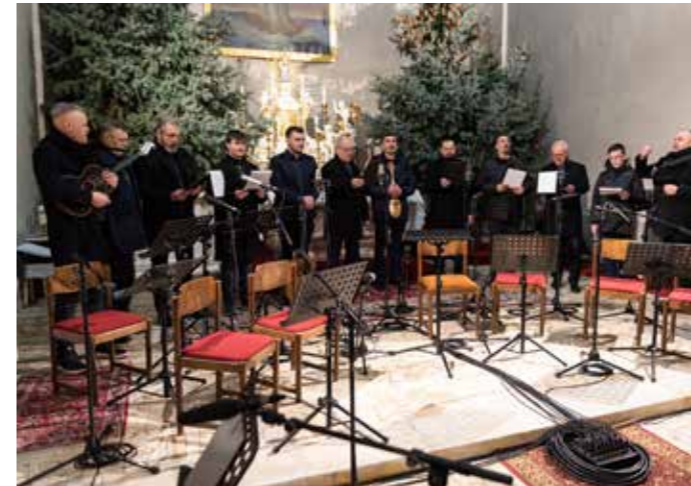
Muško jačkarno društvo Hrvatski Jandrof