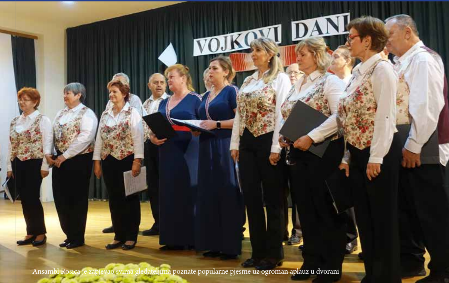
Ansambel Rosica je zapjevao svima gledateljima poznate popularne pjesme uz ogroman aplauz u dvorani