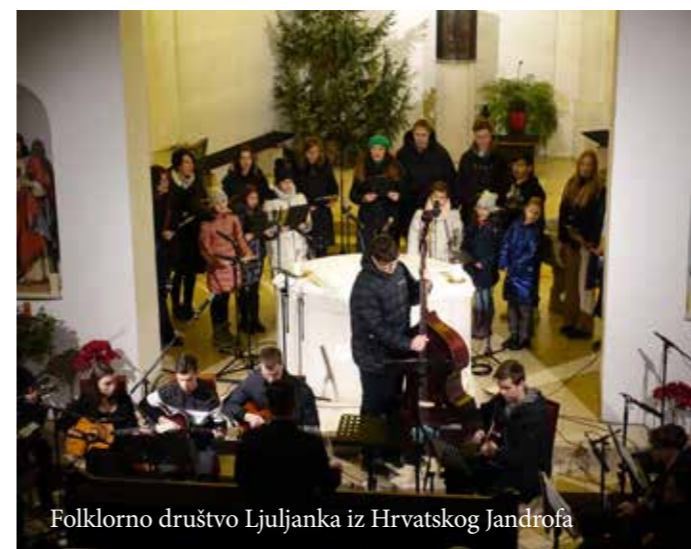
Folklorno društvo Ljuljanka iz Hrvatskog Jandrofa