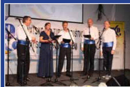
Strana 21 Ravnica i Rožice u Filežu