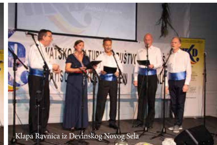
Klapa Ravnica iz Devinskog Novog Sela