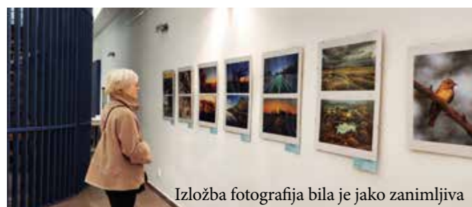
Izložba fotografija bila je jako zanimljiva

Od odabраниh najzanimljivijih fotografija Istra Centar zajedno sa novoselsku gmajnu svake godine pripremi aktualni zidni kalendar koji redovito zauzima prva mjesta u natjecanju kalendara u kategoriji Zidni kalendari - Općine. Kalendar se može kupiti u muzeju do isteka zaliha.