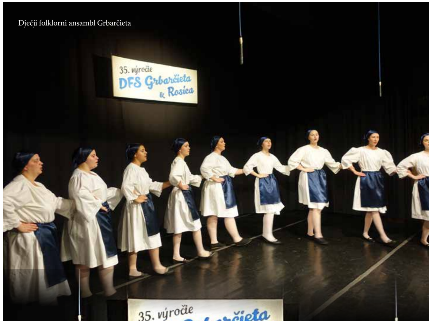
Dječji folklorni ansambl Grbarčieta