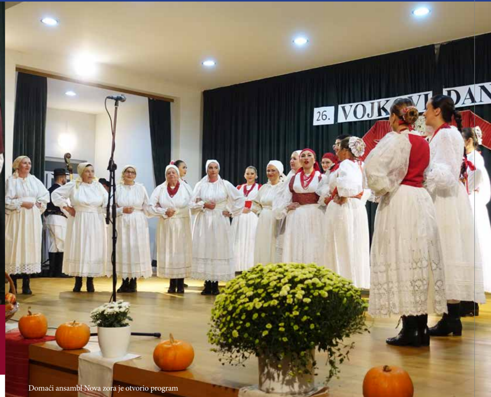
Domaći ansambel Nova zora je otvorio program

Uoči događaja sudionici položu vijenac na njegov grob i njemu u spomen se u mjesnoj crkvi služi sveta misa. U subotu predvečer se gotovo cijelo mjesto, predvođeno načelnikom i župnikom, okupi u mjesnom domu kulture kako bi pratilo bogat kulturni program u kojem nastupaju domaći i pozvani ansambli.