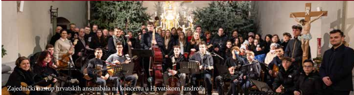
Zajednički nastup hrvatskih ansambala na koncertu u Hrvatskom Jandrofu

Druga i treća adventska subota i nedilja u naši seli je bila određena za hrvatske adventske i božićne jačke i kolede. Tako su se bili u ovi četiri dani u naši seoski crikva sa svojim programom predstavili naša domaća folklorna društva. U svakoj pojedinoj seoskoj crikvi su tako mogli gledatelji doživjeti isti adventski i božićni program.