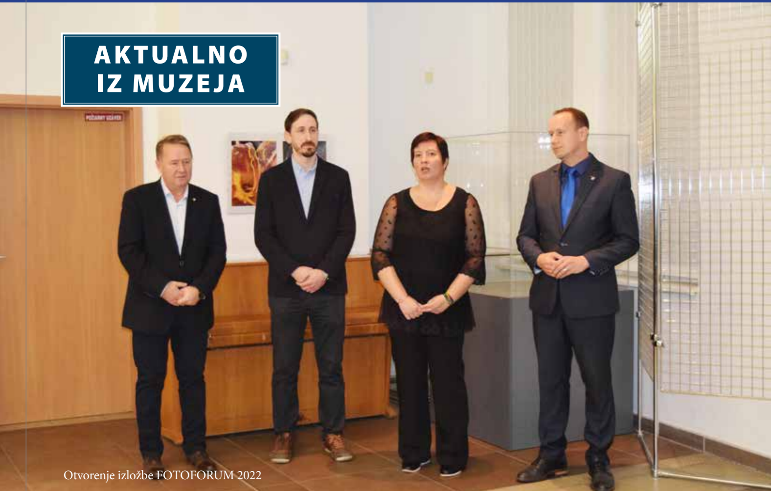
Otvorenje izložbe FOTOFORUM 2022