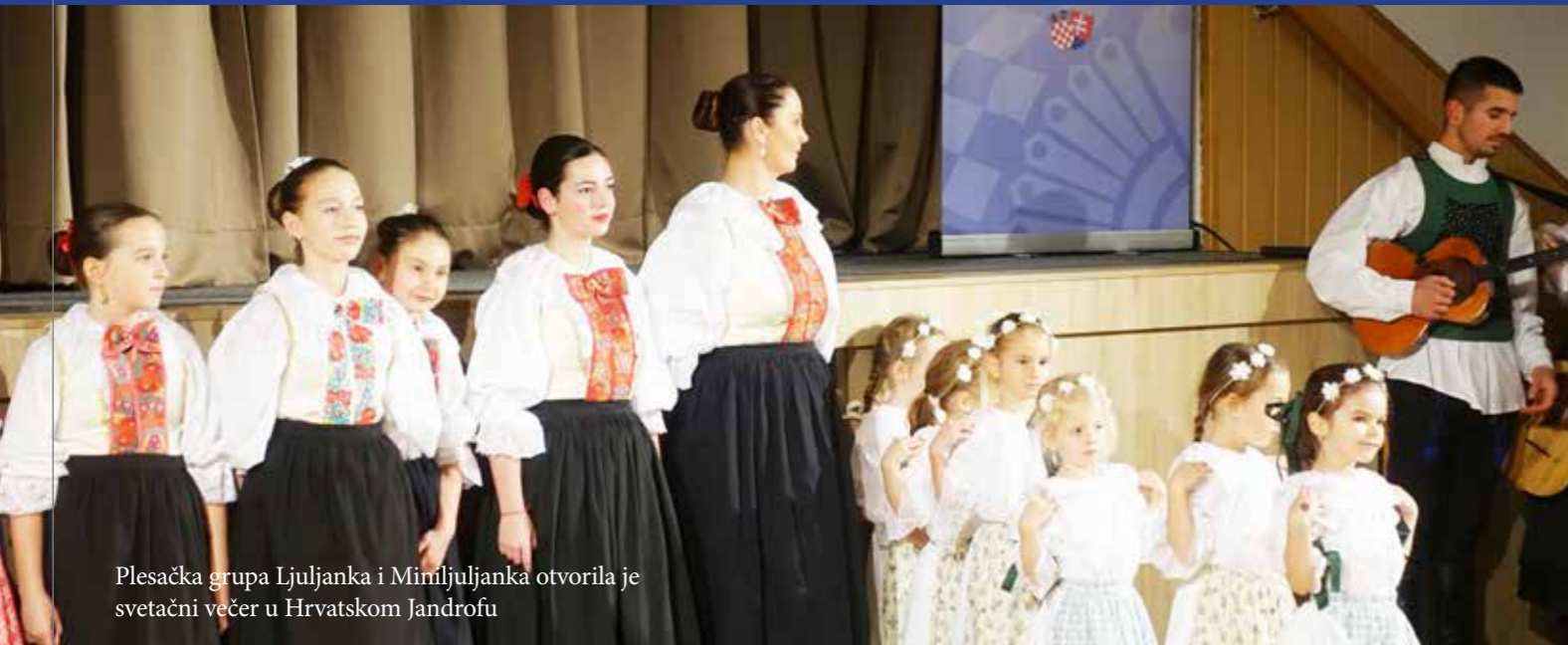
Plesačka grupa Ljuljanka i Miniljuljanka otvorila je svetačni večer u Hrvatskom Jandrofu