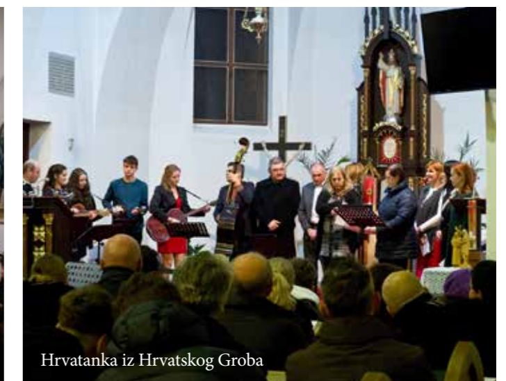
Hrvatanka iz Hrvatskog Groba