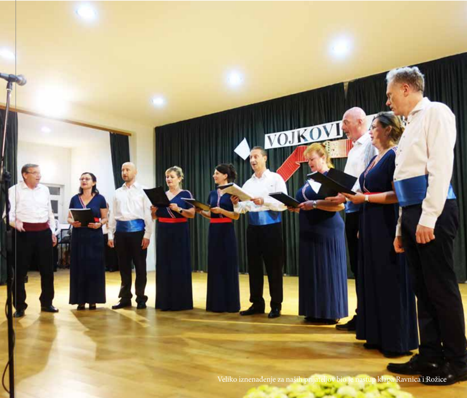
Veliko iznenađenje za naših prijateljev bio je nastup klapa Ravnica i Rožice