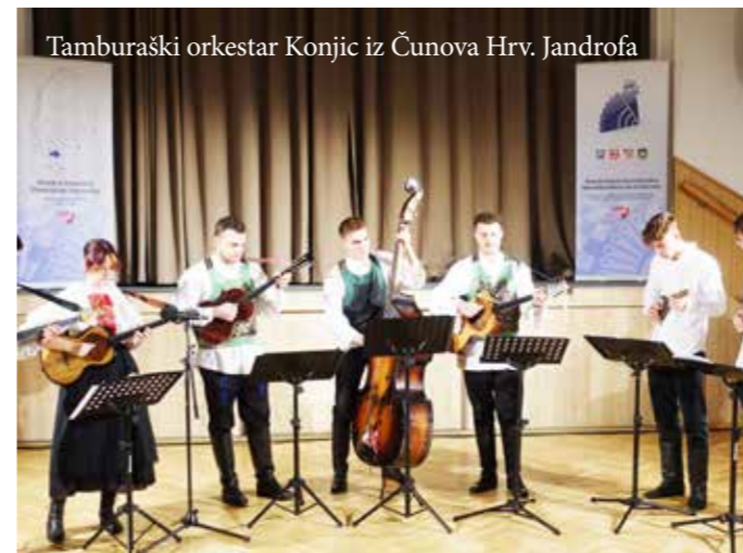
Tamburaški orkestar Konjic iz Čunova Hrv. Jandrofa