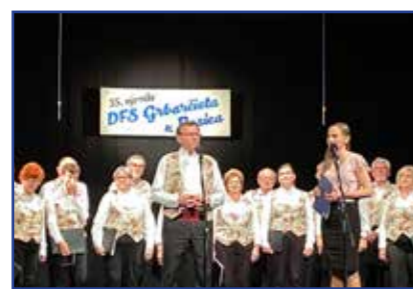
Strana 8 Novoselski slavljenici