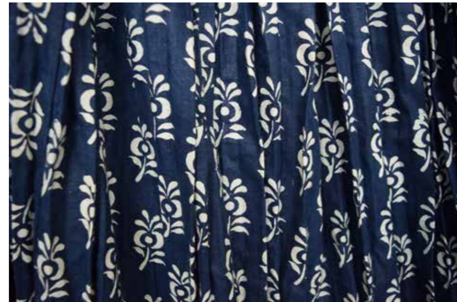
Detalj uzorka plavotiskane suknje iz 1. polovice 20. stoljeća