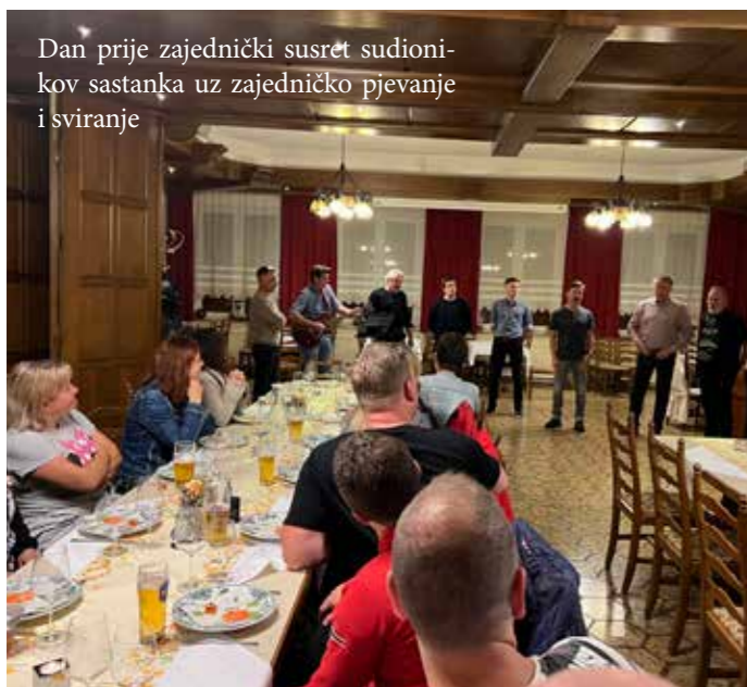
Dan prije zajednički susret sudionikov sastanka uz zajedničko pjevanje i sviranje