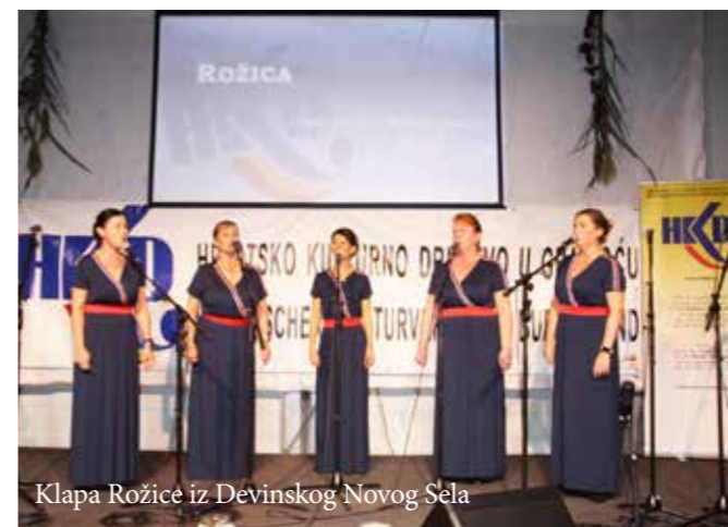
Klapa Rožice iz Devinskog Novog Sela