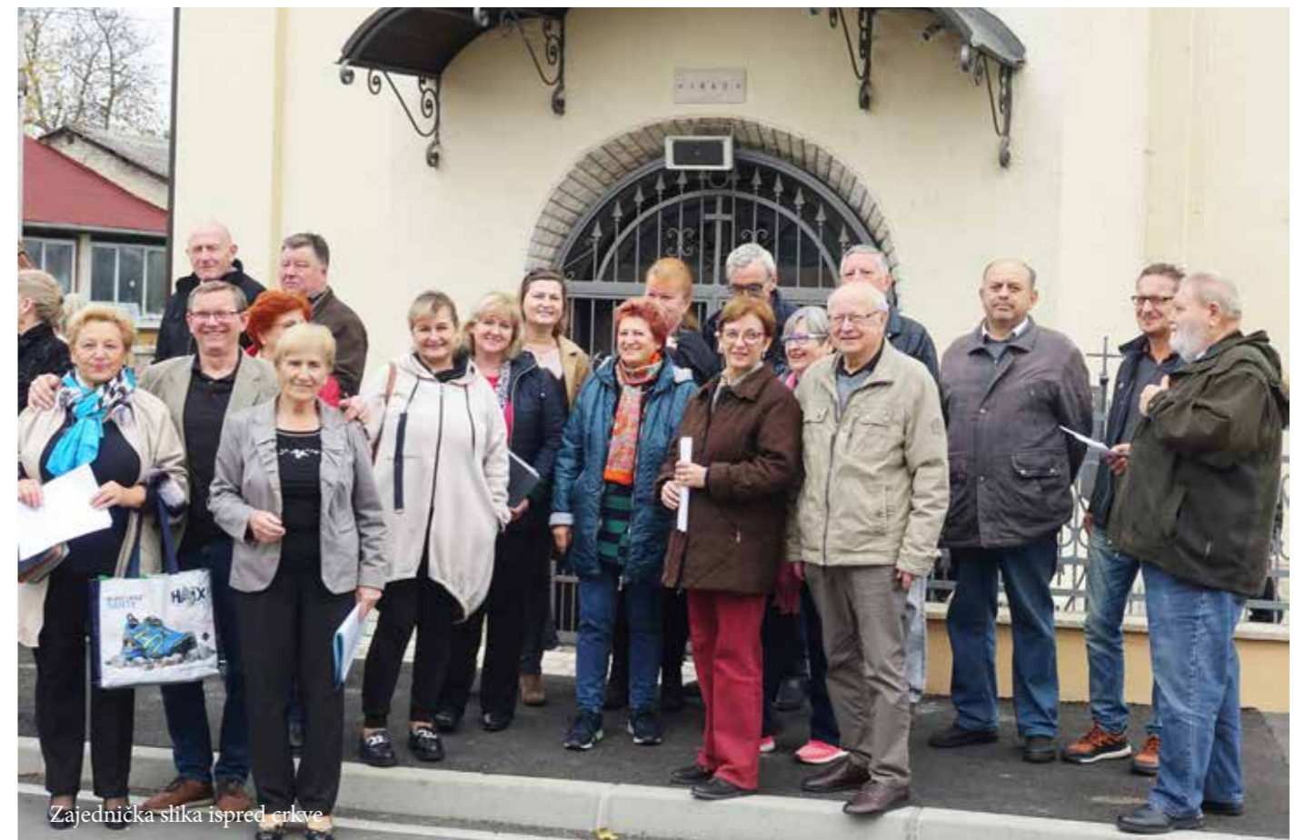
Zajednička slika ispred crkve