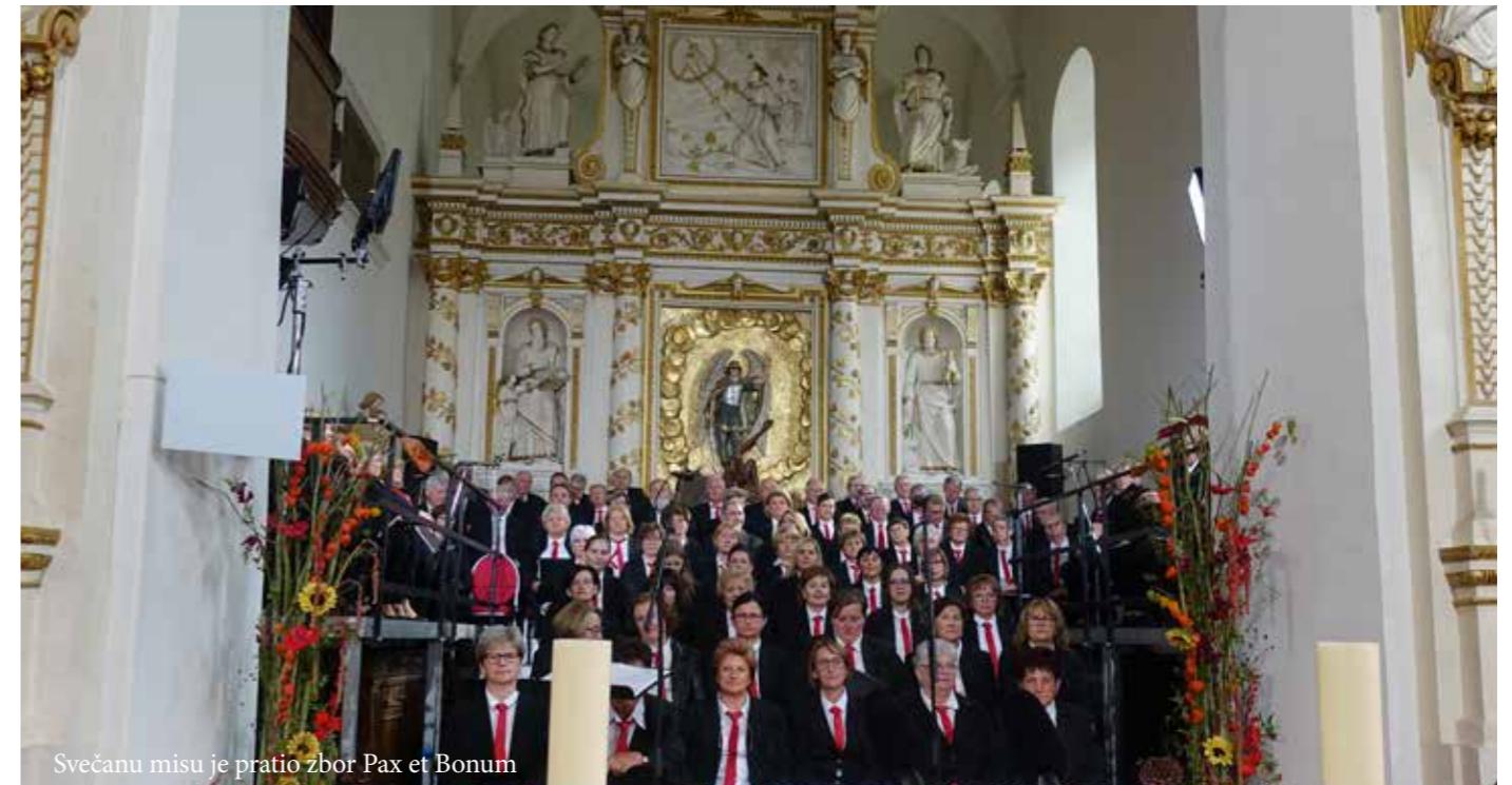
Svečanu misu je pratio zbor Pax et Bonum