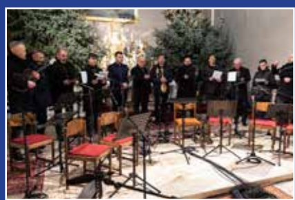
Strana 4 Adventske koncerte u Slovačkej