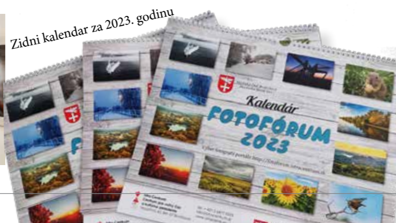
Zidni kalendar za 2023. godinu