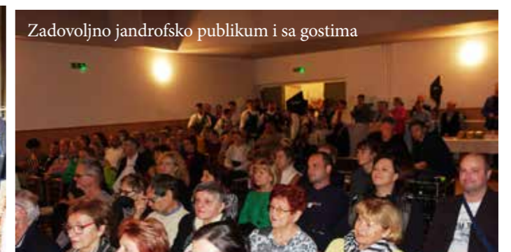
Zadovoljno jandrofsko publikum i sa gostima

Na priredbi su nastupala i društva, ka dugoljetno s MJD sudjeluju. Tako su se bili u programu predstavili plesačke grupe: „Ljuljanka“ i „Mini-Ljuljanka“ iz Hrvatskoga Jandrofa sa svojim koreografijama, Tamburaški orkestar „Konjic“ iz Čunova i Hrv. Jandrofa i Tamburaški sastav „Čunovski bečari“.